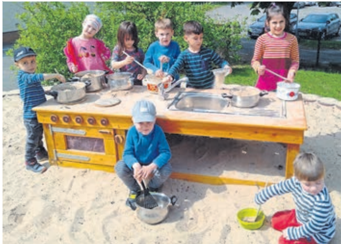
Die Kinder der Kita „König Konrad“ freuen sich über die neue Spielküche.