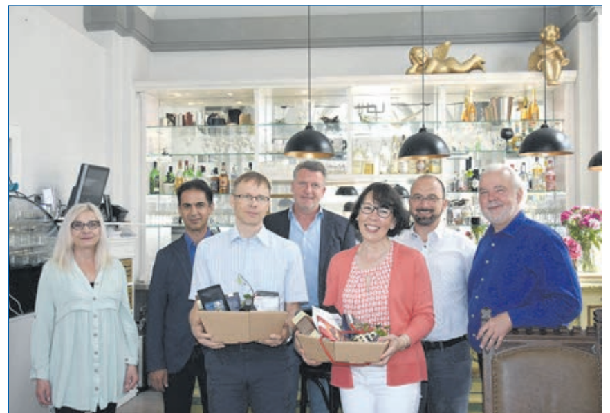
70 Jahre WWW mit Neuwahlen und Abschieden