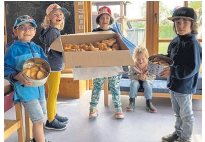
Stolz präsentieren die Kinder der Kita „Kuckucksnest“ die selbstgemachten Brötchen und Plätzchen.

Große Freude herrschte auch bei den Kindern der Kita „König Konrad“, denn sie haben von einer Familie aus der Gruppe „Blumenwiese“ eine tolle Matschküche für den Außenbereich gespendet bekommen. Diese hat der Vater der Familie selbst gebaut. Einige Wochen hat er daran gearbeitet und viel Zeit in die Spielküche investiert. Die Spielküche hat ein eingelassenes Becken, einen Backofen