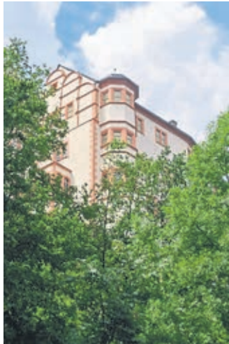
Weilburg einmal anders erleben bei einer Stadtführung.

Samstag, 25. Juni , 15 Uhr ab Marktplatz: Themenstadtführung „Weilburg einfach mär-