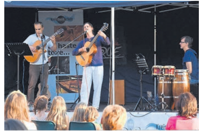
Latineando spielen beim „wellenSchlag22“.

11 Uhr: Tanz und Musik mit den Kindergruppen der Klassen Irina Hüttenschmidt, 12 Uhr: Bläserklasse der Fritz-Philipp-Schule Breitscheid (Heike Schlicht), 14 Uhr: „Tabaluga und die Reise zur Vernunft“ Musical-Szenen mit den Kinderchören der Christian-Spielmann-Schule Weilburg und Karl-Schapper-Schule Weinbach, 17 Uhr „Monika Häuschen“ Marionetten-Theater Jörg Schmidt, 19 Uhr „Choro Café“ Brasilianische Salonmusik.