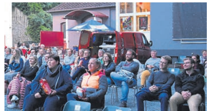
Open Air Kino 2021.

Kontakt: Telefon: 06471-944210 und -11. Vorbestellungen auch auf der Homepage www.weilburger-schlosskonzerte.de .