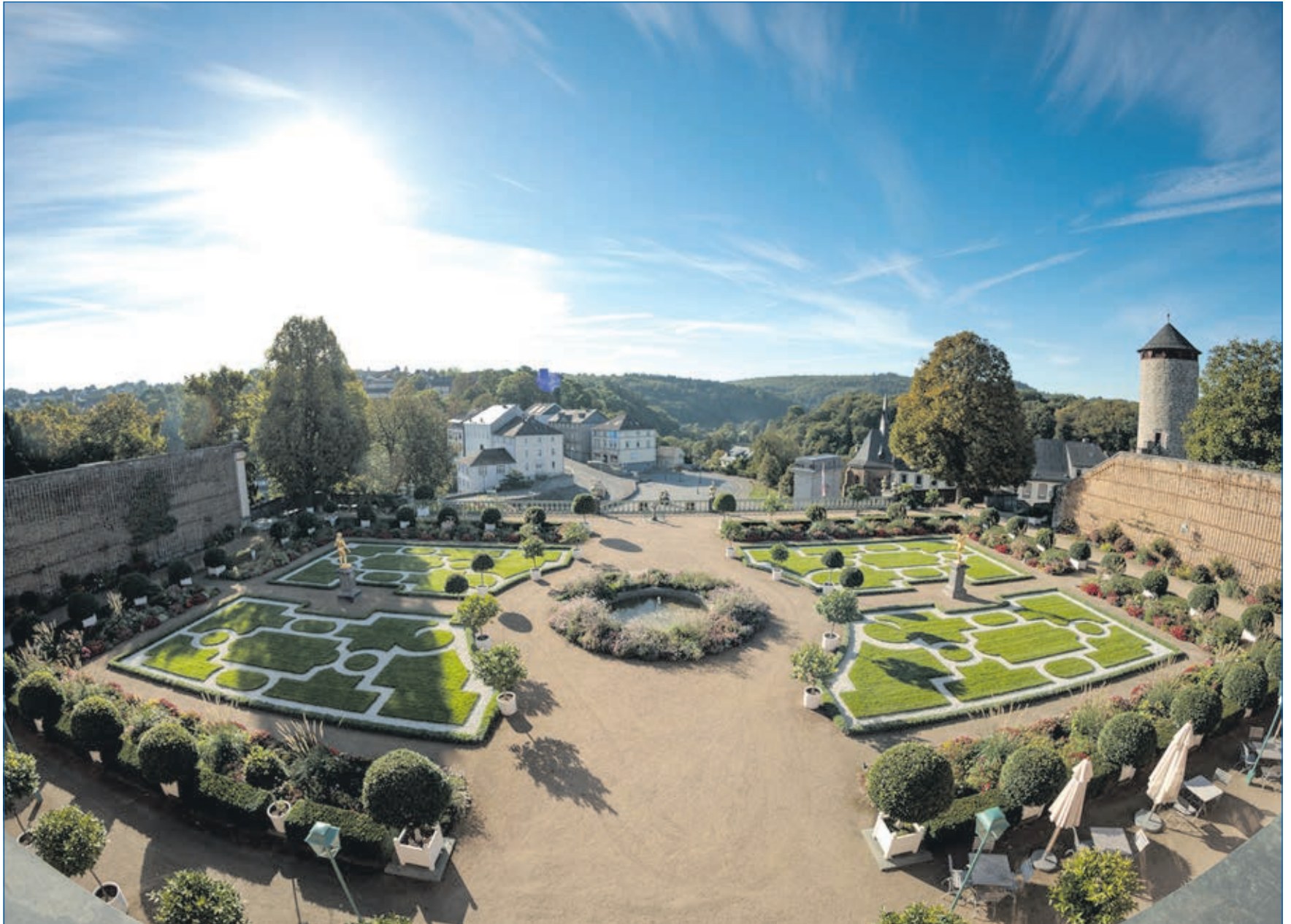
Weilburg ist sehenswert: Unsere Panoramaseiten zeigen einen Ausschnitt davon