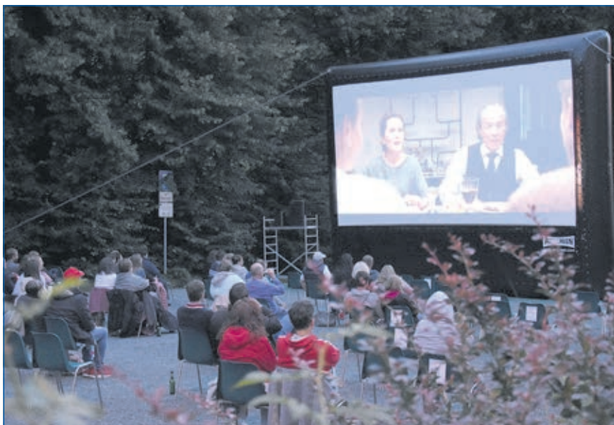
20 Jahre Delphi Filmtheater mit Open Air Vorstellungen