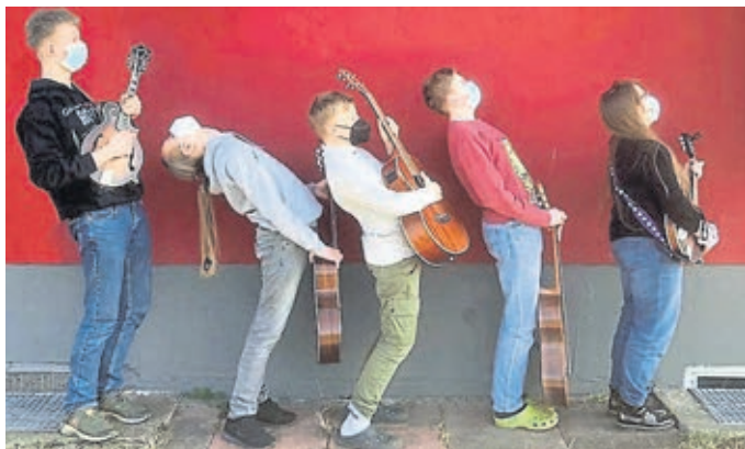
Stabile Saitenlage treten am 21. Juni auf.

18 Uhr: Offenes Singen mit Sängern des Liederkranzes Weilburg und dem Streicherensemble I Salonisti (Friederike Kremers), 19 Uhr: Stabile Saitenlage (Kuno Wagner) und weitere Ensembles der Kreismusikschule, 20 Uhr: Feel-Harmony, Gospelchor Merenberg (Ulrike Viel). Der Städtepartnerschaftsverein Weilburg bewirbt die Gäste.