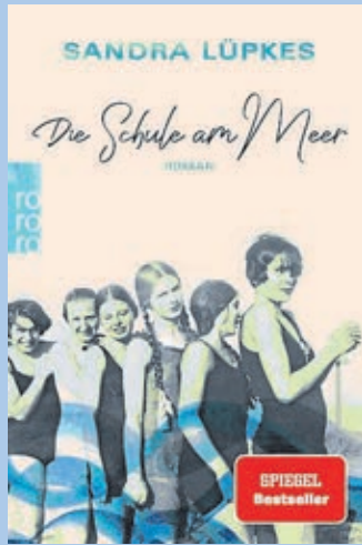
Sandra Lüpkes verbindet in ihrem Roman Recherchiertes und Fiktion.

Kontakt: Residenz-Buchhandlung, Langgasse 31-33, 35781 Weilburg, Telefon 06471-30024.