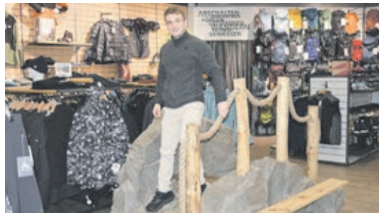
In der Wanderschuhabteilung sorgt die neue Schuhteststrecke dafür, dass kein Schuh mehr drückt.