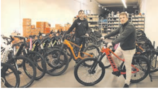
Neue Fahrradausstellung. Endlich treffen die ersten neuen E-Bike-Modelle ein. Geführt werden die Hersteller Genesis, Diamant, KTM und Trek.