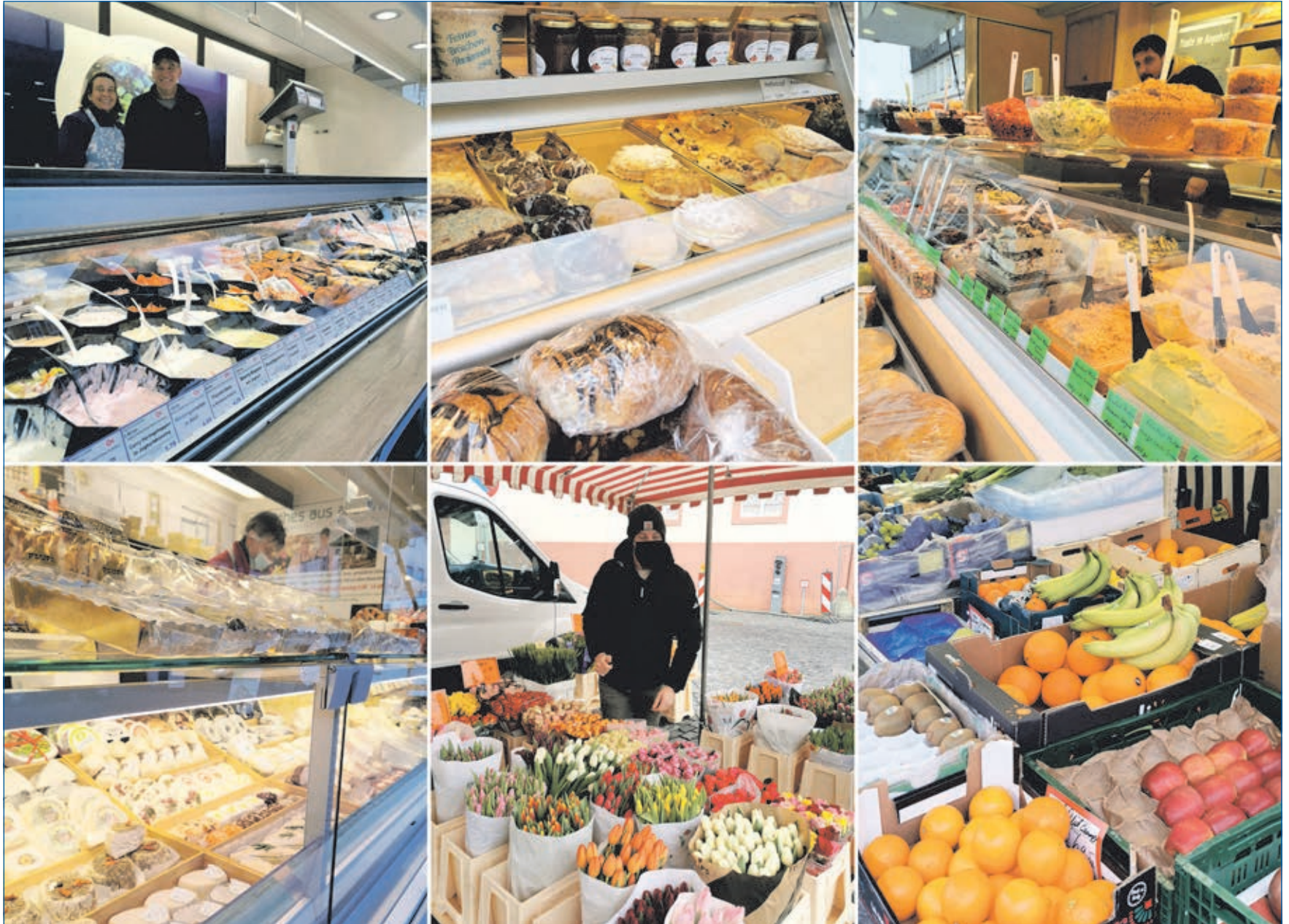
Kulinarisches Weilburg vom Wochenmarkt (Seite 4) bis zur Gastronomie (ab Seite 7).