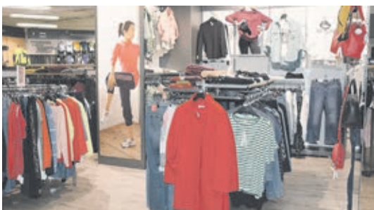
Hier gibt es Damen-Mode: Mit monatlichen neuen Lieferungen von S.Oliver wird topaktuelle Mode geboten – und dies auch für die Herren.