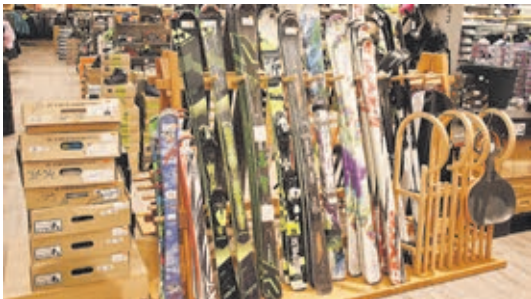
Beinahe zu verschenken: Mit bis zu 75 Prozent im Preis reduziert suchen nach der Aufgabe der Ski-Abteilung die letzten Ski und Skischuhe noch einen neuen Besitzer.