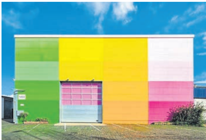
Das Reiseziel in Köln.

chern das erfolgreichste und größte seiner Art in Europa. Die Gruppe hat dort zwei Stunden zur Verfügung. Die Teilnehmekosten betragen 15 Euro. Die Abfahrt ist für 9 Uhr am Jugendzentrum Weilburg, Frankfurter Straße (ehemalige Spielmansschule, Parkplatz) vorgesehen, die Rückkehr für etwa 16.30 Uhr. Die Teilnehmerzahl ist begrenzt. Ein aktueller Coronatest, der maximal 24 Stunden alt sein darf, ist nötig. Anmeldungen sind ab dem 1. März ab 10 Uhr unter www.weilburg.de möglich.