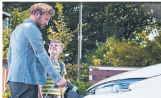
Die Experten der Kreissparkasse Weilburg beraten zu den Möglichkeiten. Beratungstermin unter Telefon 06471-3120

• Mit moderner Heizungsanlage: Senken sie klimaschonend die