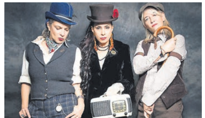
Das Trio interpretiert Tom Waits neu.