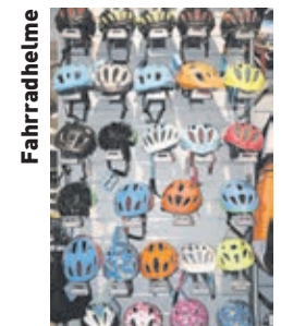
Mit mehr als 600 Helmen wird eine sehr große Auswahl bereit gehalten.