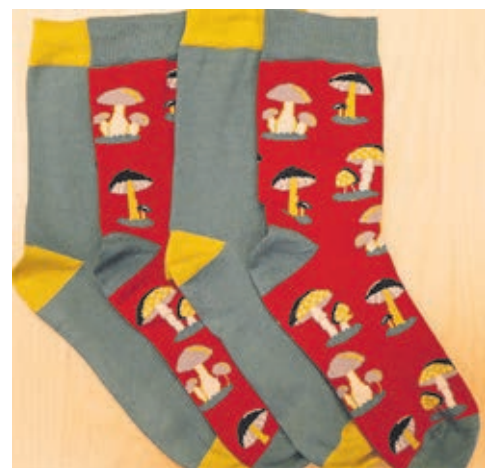
Socken: fair und lustig.

Kontakt: Weltladen Zwei, Mauerstraße 9, 35781 Weilburg, Telefon 06471-6291450, Internet www.weltladem-weilburg.de .