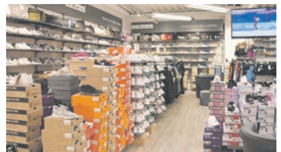
Ein Blick in die Damenschuhabteilung.