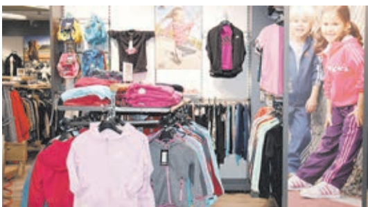
In der Kinderabteilung sind viele Markenartikel und günstige Exklusivmarken von Intersport erhältlich.

Kontakt: Intersport Gros, Keilswingert 12, 35781 Weilburg, Telefon 06471 922430, www.intersport-gros.de .