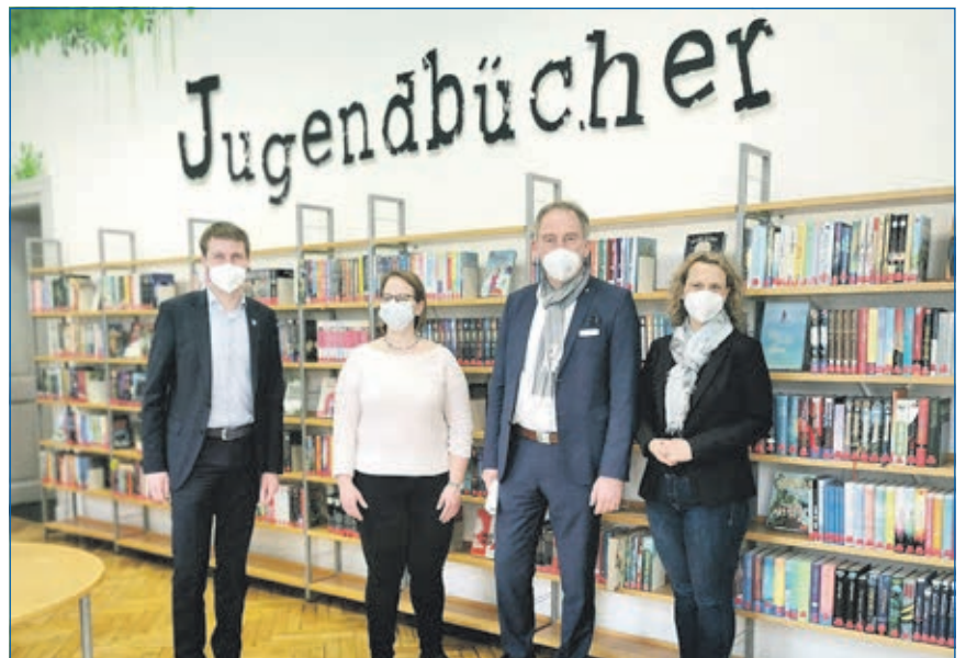
Die Kreis- und Stadtbücherei hat jetzt einen Raum für die Jugend Seite 2