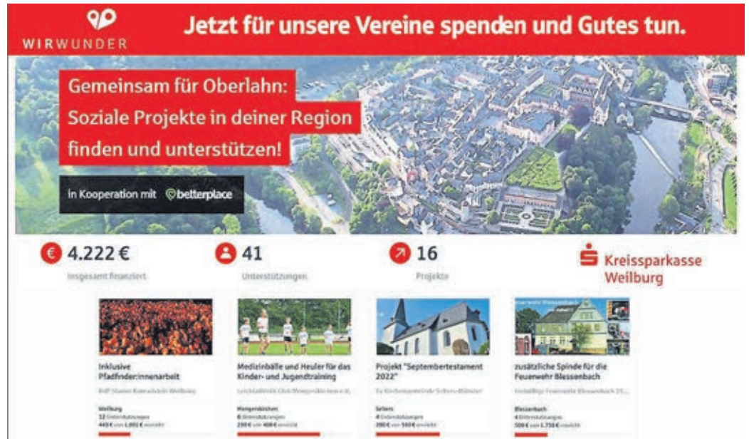
Jetzt regionale Projekte unterstützen auf www.wirwunder.de/oberlahn

nen zu Projekten erhalten, die interessieren.