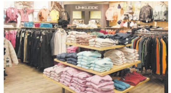
Top modische und funktionelle Outdoorbekleidung finden die Kunden in der Damenabteilung.

(bach) „Uns liegt Ihre Sicherheit am Herzen“, so lautet im März das Motto bei Intersport Gros in Weilburg. Daher sind alle Fahrradhelme zum Saisonauftakt bis zum 19. März um 15 Prozent im Preis reduziert. Dabei kann aus einem Angebot von mehr als 600 Helmen ausgewählt werden.