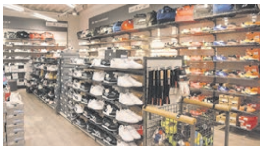
In der Herrensuhabteilung sind die neuesten Freizeit-, Running- und Sportschuhe schon eingetroffen.