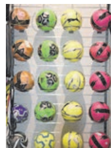
Die Ballwand zeigt Bälle in vielen Farben und Größen.