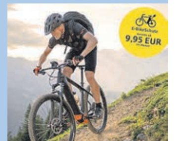
Ab 9,95 Euro pro Monat unter www.ksk-weilburg.de/ebikeschutz .

Unfall und Sturz, Vandalismus, Brand, Blitzschlag, Explosion sowie gegen Schäden durch Sturm, Hagel und Überschwemmungen. Schäden am Akku durch Feuchtigkeit, Kurzschluss, Induktion oder Überspannung sind ebenfalls versichert.