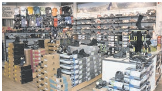
Mit der größten Auswahl an Wanderschuh im gesamten Umfeld dürfte es in der Wanderschuhabteilung kein Problem sein, für jeden den passenden Schuh zu finden.