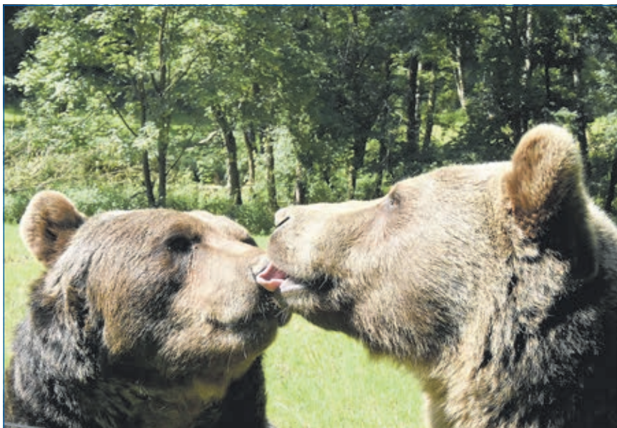
Auch im Tiergarten hält der Frühling Einzug.