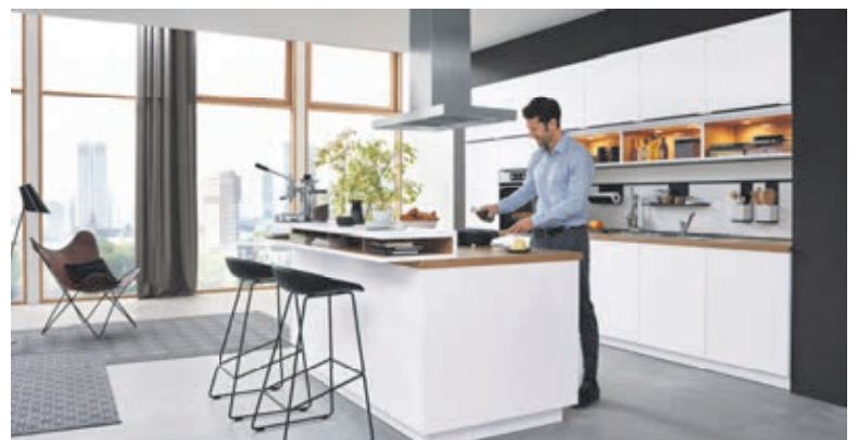
Für Druckfehler keine Haftung. Irrtümer vorbehalten. Abbildungen sind Musterbeispiele.