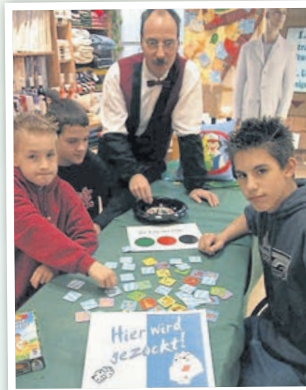
„Weilburg zockt“ hieß es in den WWW-Geschäften 2002.