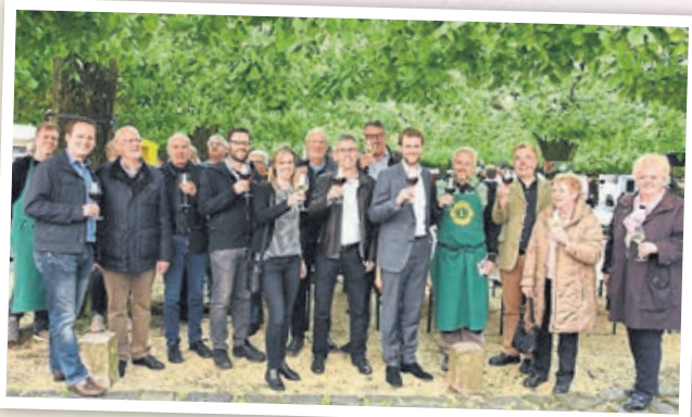
Beliebtes Ereignis im Sommer: Das KLA-Weinfest (2019).