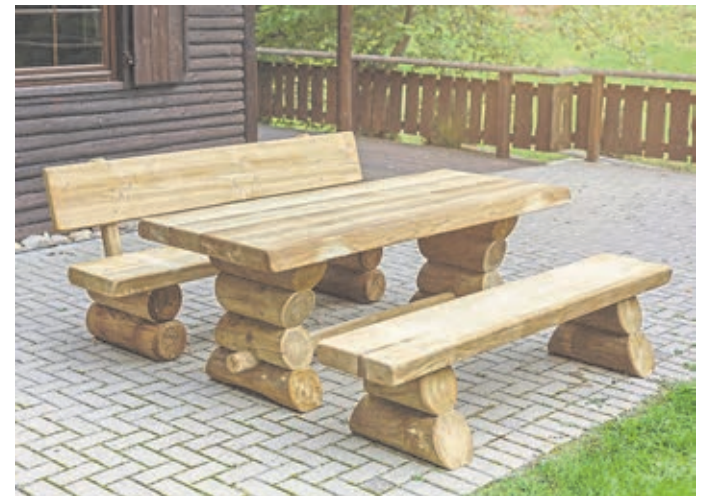
Eine attraktive Sitzgruppe aus massivem Holz.

Kontakt: Keil Baustoffe GmbH Stroh Weilburg, Löhnberger Weg, 35781 Weilburg, Tel. 06471-92720, www.keil-baustoffe.de