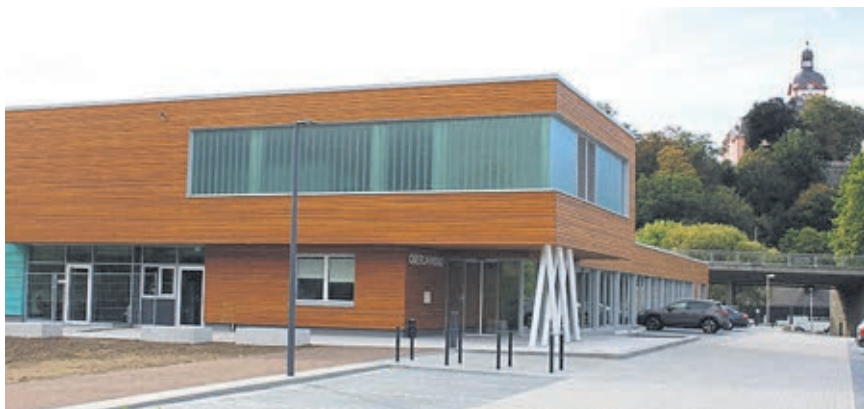
Das neue Oberlahnbad.