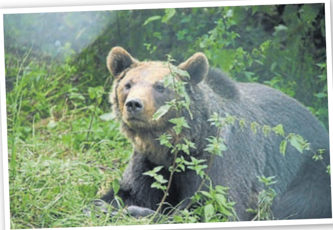
2009 wurde das Bärengehege eingeweiht. Bär Tim ist da noch ganz neu in Weilburg.

Meilensteine der Karriere des Wildparks sind: Bau des Elchgeheges (1998), Umbau des Fischottergeheges (2006), Bau des Braunbärengeheges (2009), Schaffung des Kinderforsthauses (2010), Neubau des Wildkatzengeheges (2012), Neubau des Luchsgeheges (2014), Bau der Besu-