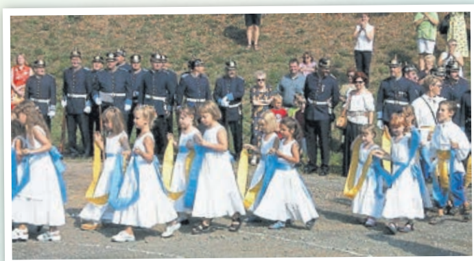
Der Kirmestanz der Mädchen bei der Kirchweih 2001.