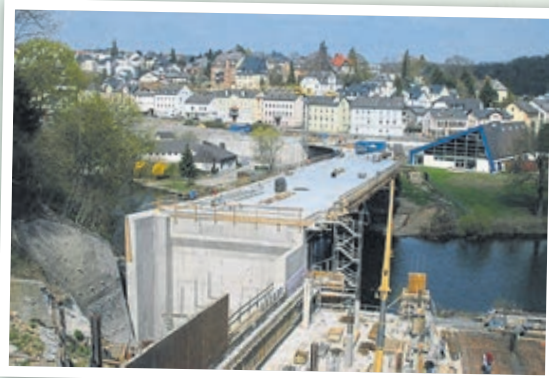
Die neue Oberlahnbrücke wird gebaut (2004).