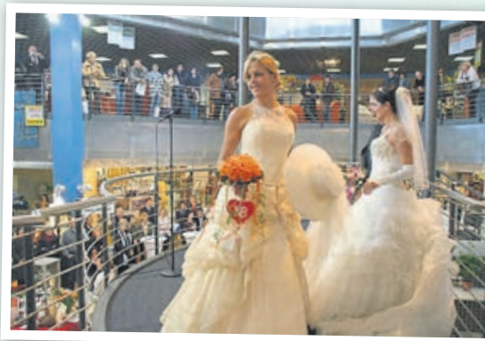
Hochzeitsmesse bei Wohnkauf Zeller (2008).