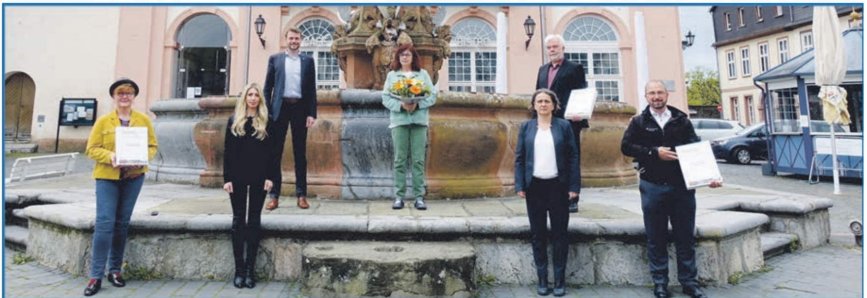
Das Redaktionsteam der Weilburg live 2021

Die bunte Vielfalt der Themen spiegelt sich auch in den Titelseiten wider