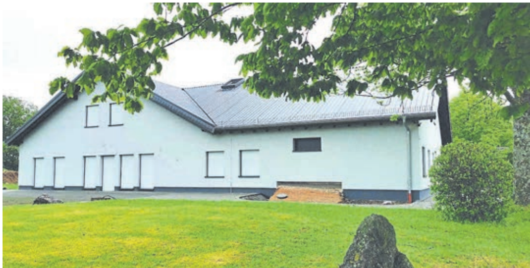
Das Kubacher Höhlenhaus im neuen Gewand.