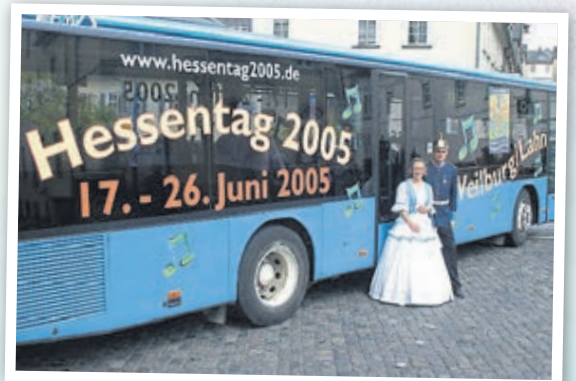
Das Weilburger Hessantagspaar (2005).