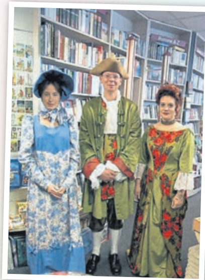
Die Team der Residenzbuchhandlung im historischen Gewand (2000).