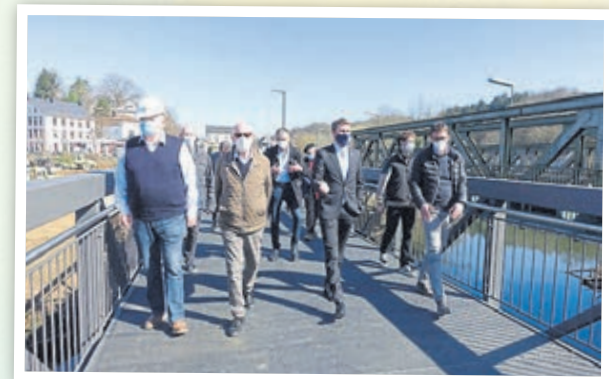
Der neue Eiserne Steg (2021).