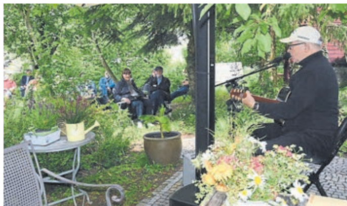
Bei einem Gartenkonzert im letzten Jahr.

Für die Gartenkonzerte ist eine Anmeldung mit Angabe aller Namen, Vornamen, Adressen und Telefonnummern unter a.mueller.60@gmx.de erforderlich. Die Daten werden ausschließlich für eine etwaige Nachverfolgung bei einer Corona-Infektion verwendet und vier Wochen nach der jeweiligen Veranstaltung gelöscht. Bei den Konzerten ist ein Hygienekonzept zu beachten. Für Getränke ist gesorgt. Eine Hutspende wird als Gage für die Auftretenden gesammelt.