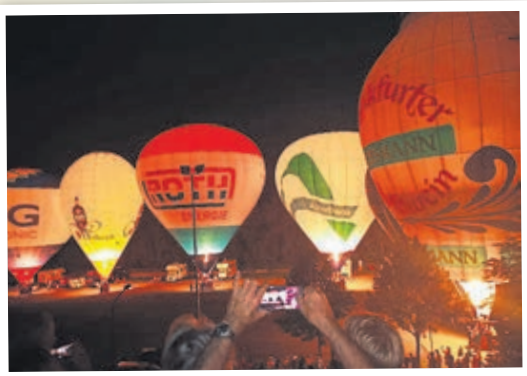
Ballonglühn im Rahmen der Kirchweih (2019).