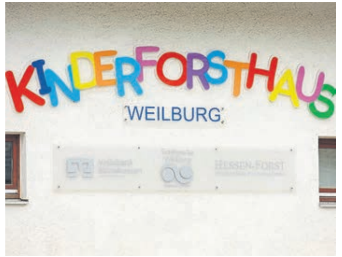
Das Kinderforsthaus wurde renoviert.