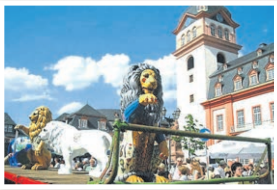
Vor dem Hessantag 2005 zog die Löwenparade auf.