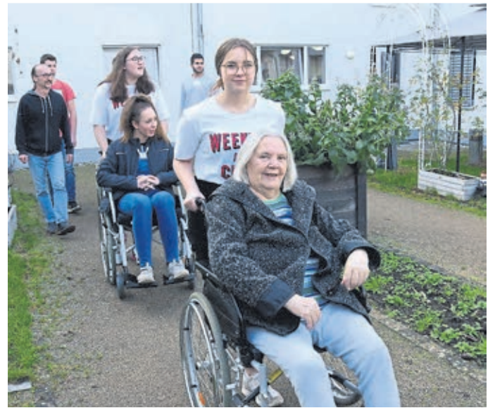
Praktika absolvieren die Krankenpflegeschülerinnen und -schüler auch im Seniorenzentrum Fellersborn.

Die vom Förderverein ins Leben gerufenen, alljährlichen Gesundheitstage haben sich zu „Selbstläufern“ entwickelt: hochinteressante Präsentationen der einzelnen Abteilungen der Klinik, motivierte und engagierte Mitarbeiter, Live-Operationen, die am