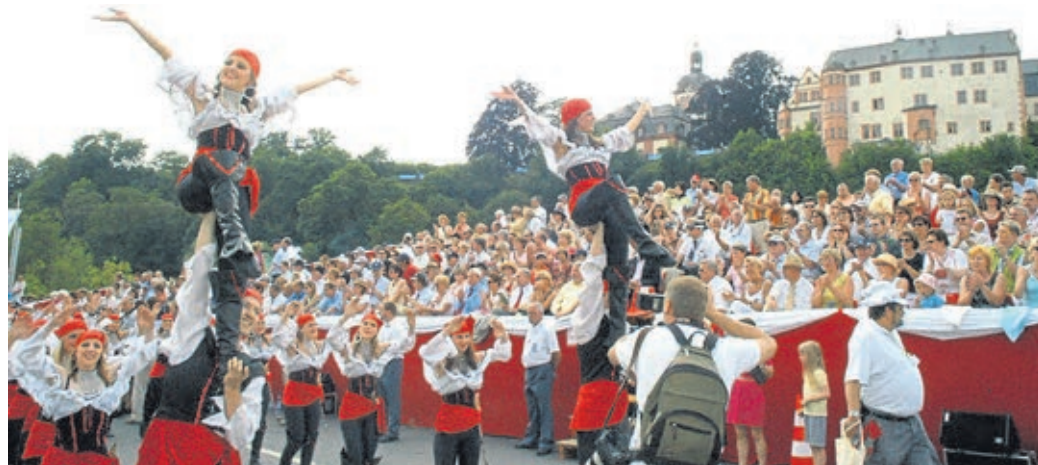
Ein prächtiger Anblick bot sich, als der Festzug beim Hessentag 2005 die Ehrentribüne mit der Kulisse des Schlosses passierte.

Die Stadt Weilburg hat sich in 25 Jahren zukunftsorientiert entwickelt und bedarf auch in den nächsten Jahren viel Engagement. Die Prädikate Luftkurort, barocke Residenzstadt an der Lahn, Europastadt, Fairtrade-Stadt, Ort der Vielfalt, Waldstadt, Schulstadt und Gesundheitsstadt beschreiben das Leben, Arbeiten und Wohnen für rund 13.000 Menschen und ein wichtiges Ziel für Touristen, Kunden, Patienten, Arbeitnehmer und Schüler. Auch in Zukunft wird die Weilburg live weiter aktiv über die Entwicklungen in der Stadt Weilburg und der Region informieren und für weitere Ideen und Impulse eine Grundlage bieten.