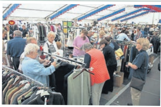
Heißbegehrt: Der heiße Markt der WWW in 2001.