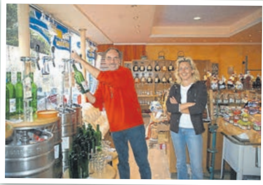
Im Bacchus in der Vorstadt (2007).