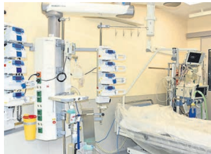
Blick in ein Zimmer der neuen Intensivstation.

Das Weilburger Krankenhaus hatte auch 2013 Grund zur Freude: Seit der „Zulassung zum Verletzungsartenverfahren (VAV) der gesetzlichen Unfallversiche-