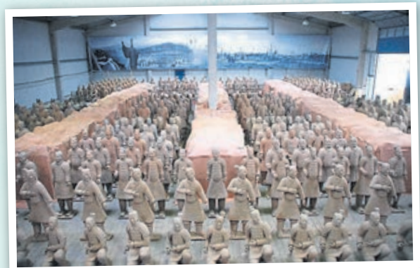
Die Terrakottaarmee in Weilburg (2007).