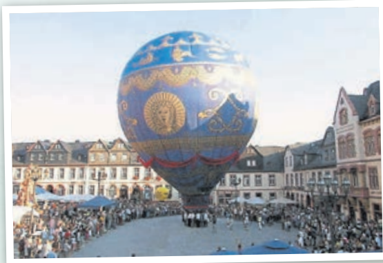
Ballonfestival 2006 auf dem Marktplatz.