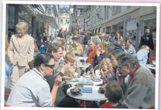
Blick in die Neugasse (2004).