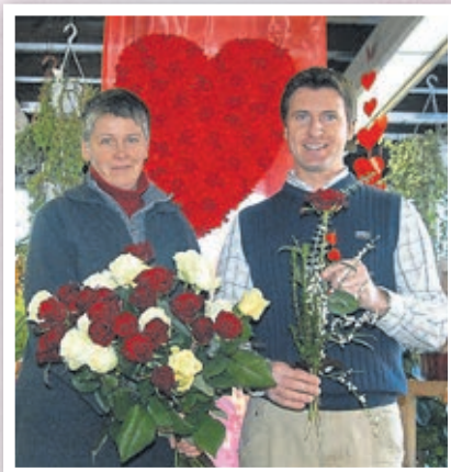
Rosen für die Kunden von der WWV zum Valentinstag (2006).