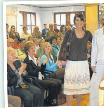
Modenschau bei Horne im Jah