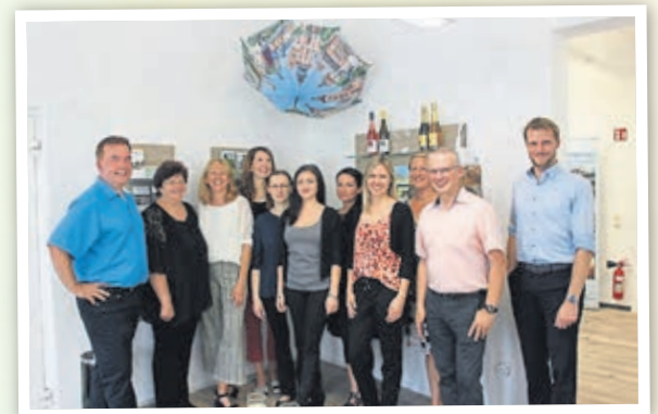
Eröffnung der neuen Tourist-Info (2019).