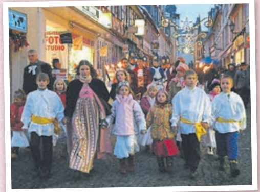
Henriettennacht anno 2006.