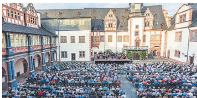
Blick in den Schlosshof.

Auch die Musikerinnen und Musiker freuen sich darauf, endlich wieder spielen zu dürfen. Selbstverständlich sind alle Hygienekon-