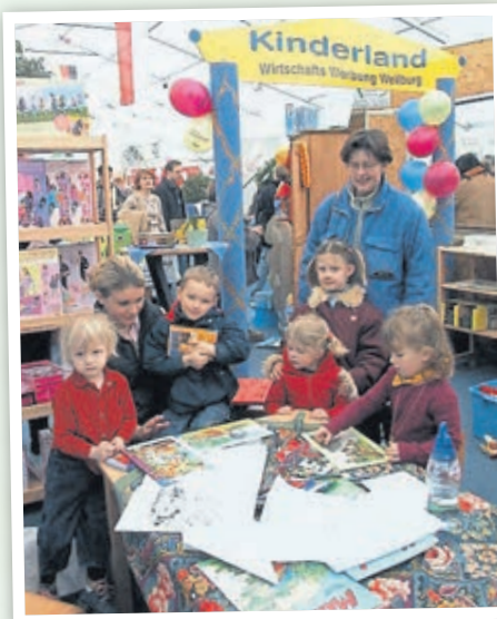
Bei der HessenSchau 2003 lud die WWW ins „Kinderland“.