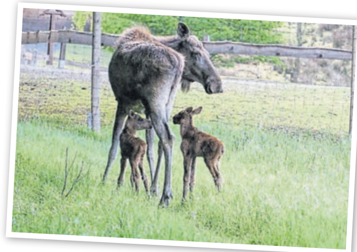
Die Elchkuh hat Nachwuchs bekommen.

1584 wird der Tiergarten Weilburg erstmals urkundlich erwähnt. 1970 wird der Wildpark in seiner heutigen Form angelegt. 1981 wird der Verein der Freunde und Förderer des Wildparks „Tiergarten Weilburg“ e.V. gegründet. In den 50 Jahren seines Bestehens konnte der Wildpark rund vier Millionen Besucher zählen; der Verein hat in den 40 Jahren den Wildpark mit rund einer Million Euro gefördert.