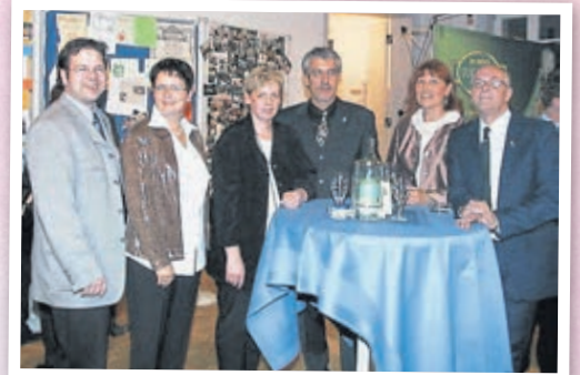
Das Team der Fremdenverkehrs Marketing GmbH (2001).