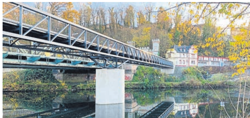
Der neue Eiserne Steg.