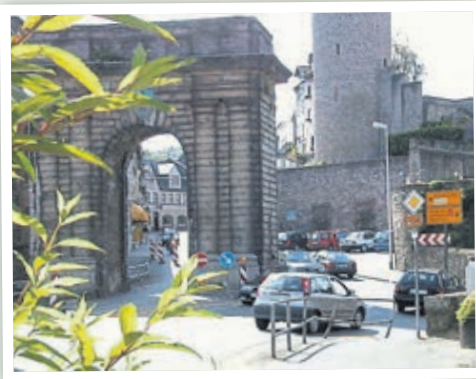
Blick auf das Landtor im Jahr 2001.