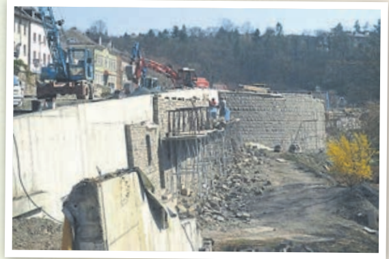
Bau der neuen Teilortsumgebung (2004).