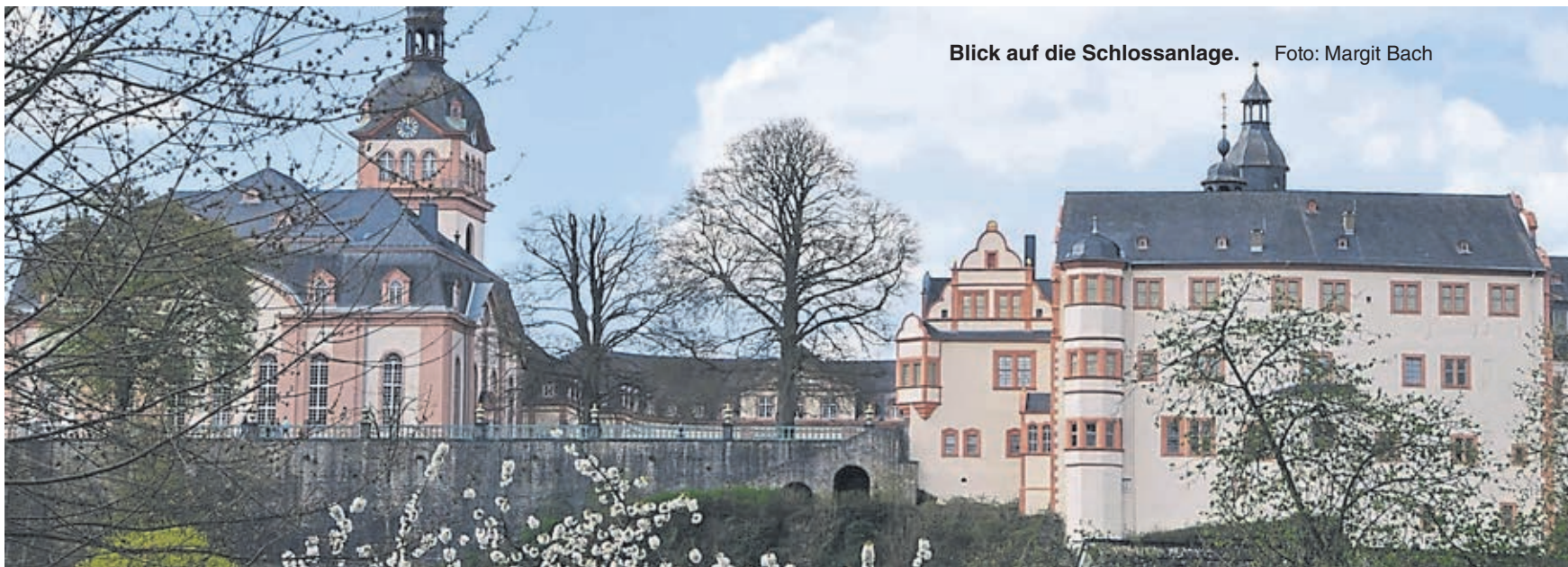
Blick auf die Schlossanlage.