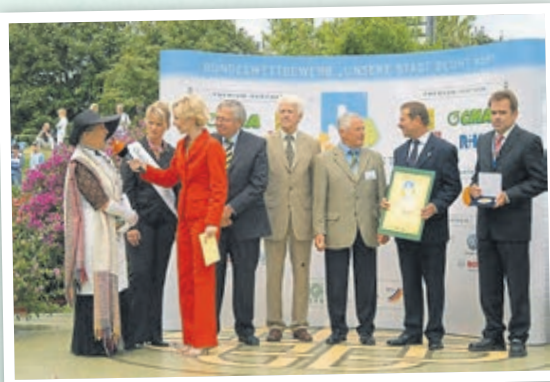
Weilburg im ZDF-Fernsehgarten beim Wettbewerb „Unsere Stadt blüht auf“ (2006).